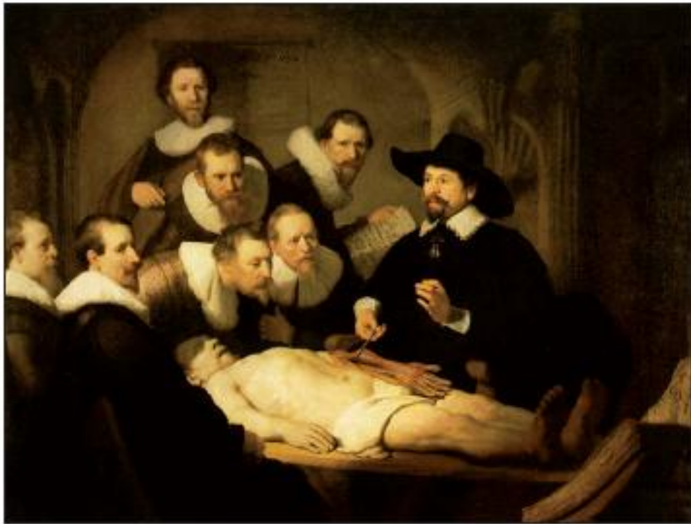
Figura 1. "La Lección de Anatomía del Doctor Tulp" de Rembrandt.

En lo que respecta al análisis del cuadro, se puede observar el fondo, en sombras, es poco visible. También se observan dos libros. El que está colocado en el ángulo inferior derecho probablemente sea un libro de anatomía, De Humani Corporis Fabrica de Andreas Vesalio (1543).