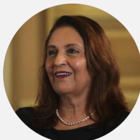
Dra. Giselle Amador Muñoz Exministra de Salud. Costa Rica