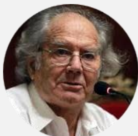
Adolfo Pérez Esquivel Premio Nobel de la Paz. Argentina